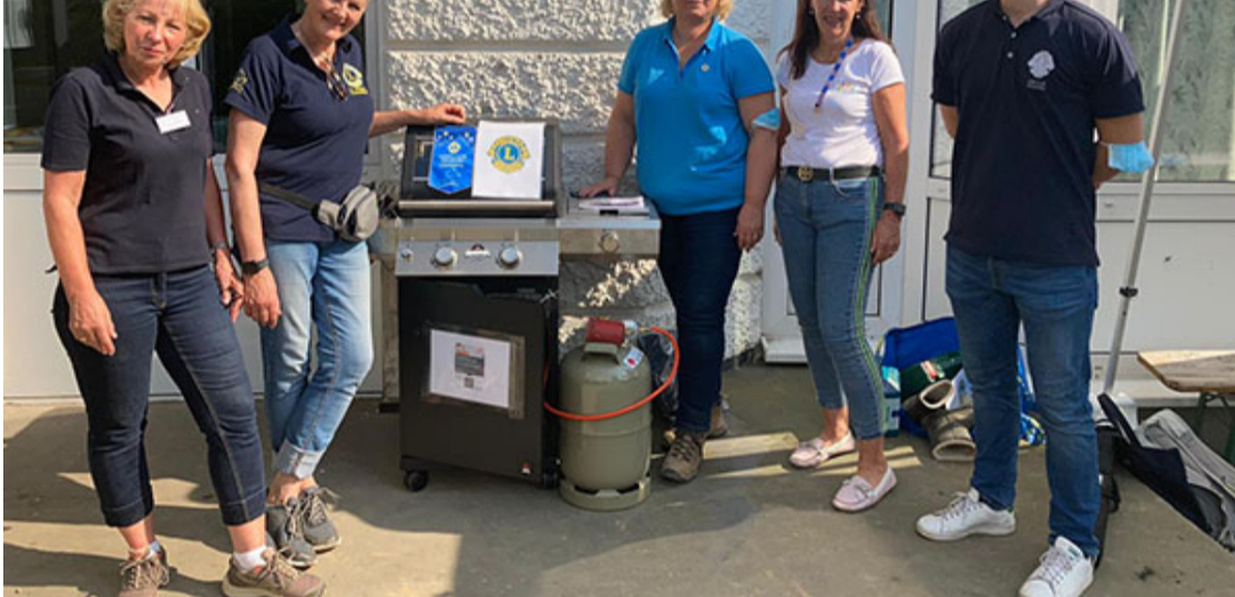
Lions und Leos organisieren einen Gasgrill.

Neben finanziellen Soforthilfen für Familien wurden Waschmaschinen und Trockner angeschafft um die Menschen in den Hochwassergebieten zu unterstützen.