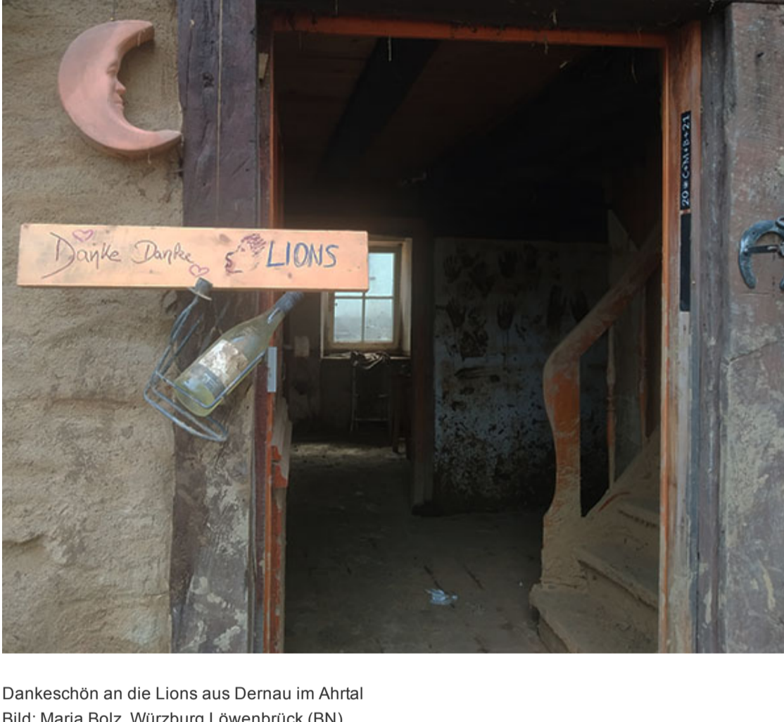
Dankeschön an die Lions aus Dernau im Ahrtal Bild: Maria Bolz, Würzburg Löwenbrück (BN)

Es gibt auch schon längerfristig ausgelegte Projekte: So wurden zum Beispiel 500 Kühlschränke für Betroffene gekauft und verteilt oder Trocknungsgeräte geliehen.